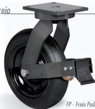
FP - Freio Pedal