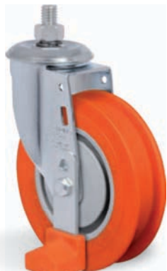
FF - Freio para esteria de supermercado Disponível 512 nas Séries L e SM