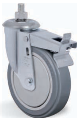
G - Freio Pedal Disponível na Série L