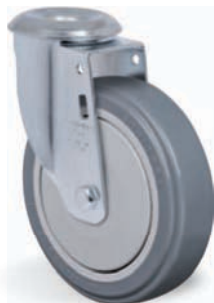
Furo Central 13mm