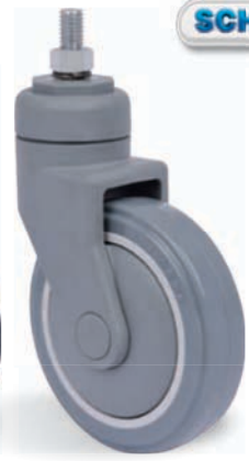
GNRE 512 BPE