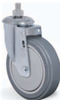
Espiga Roscada 1/2" NC x 25mm