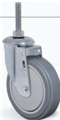
Espiga Roscada 1/2" NC x 64mm