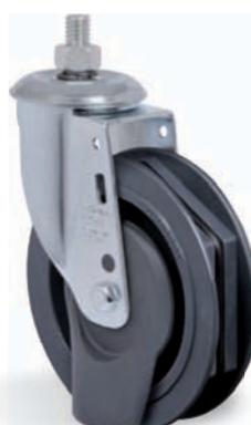
RTR C - Freio para esteria de supermercado Disponível 412 e 512 nas Séries L e NR