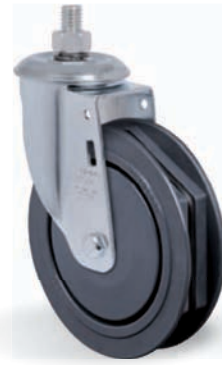
GLE 512 RTR