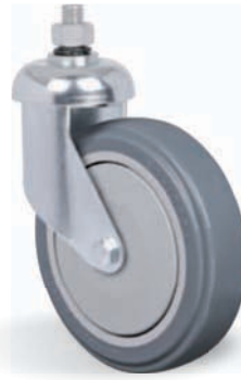
GLESM 512 BPE