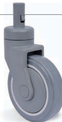
Espiga c/ Trava Ø22 x 42