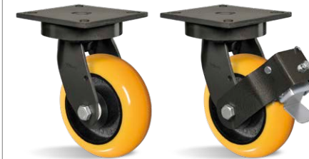
GMX 62 BCE GMX 62 BCE FP