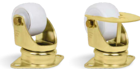
GLUP 314 NTE