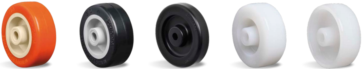
UP Antimicrobiana NP NPP NT NTT