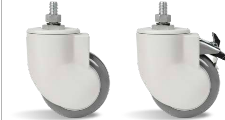
GLE CGE 412 BPE ROUND