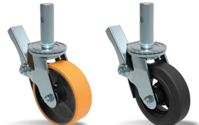
GCAEL 62 PR FP GCAEL 62 BR FP