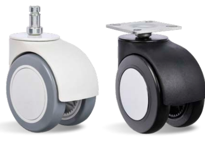
STG ELT 75 BP