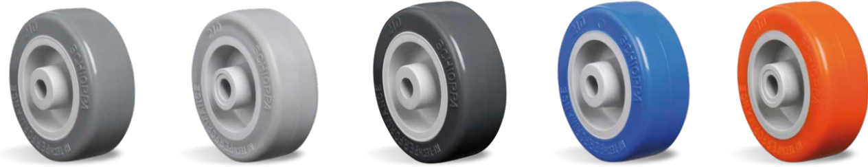
BP SP TB TP UP