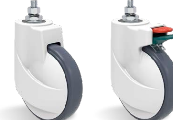
GLNE 150 UPE