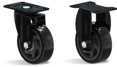
GLA 412 BPE ONIX FLA 412 BPE ONIX