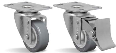
GL 210 BP GL 210 BP FP