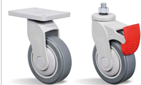
GN 312 BPE