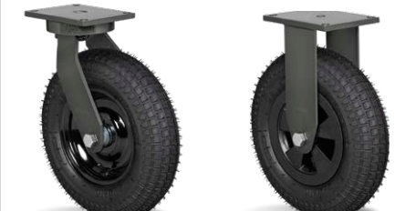
GPCX 3508 PCR FPCX 3508 PPR