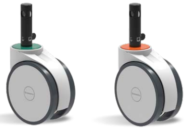
NEW AVTD 6 UPE E28.100 G30 DF NEW AVTD 6 UPE E28.100 G30 FT