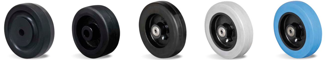
BIN BN BSE BSE CINZA BSE AZUL