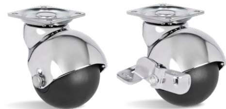
GLBP 210 NP CR