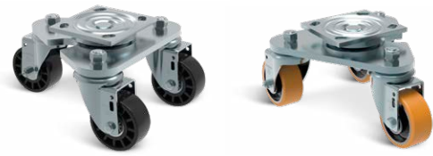
TRIPLEX S 312 NTE ITT