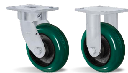
GKS 62 ACE FKS 62 ACE