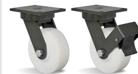
GPX 63 NME GPX 63 NME FP