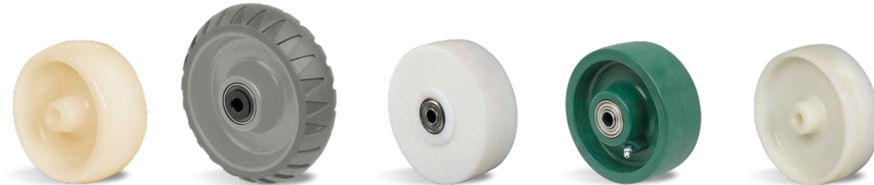
NTT Antimicrobiana STRE BPE NME NHT NFV