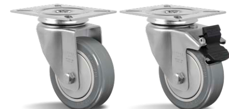
GL 414 BPE GL 414 BPE G