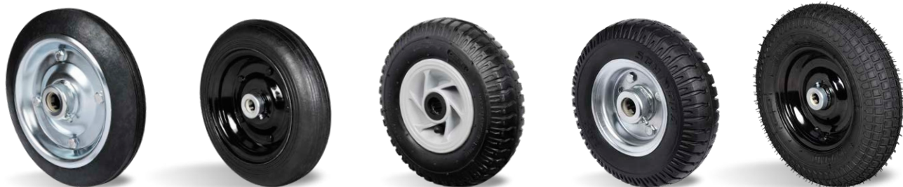
ESTAMPADA LEVE PNEUMACIÇA RIT PPN RIT PCR PNEUMÁTICA