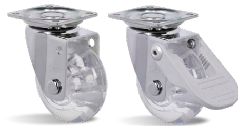
GLAP 210 GEL