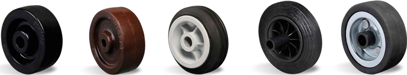
TM C BMN PMP (CONTAINER) BDN