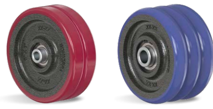
R 62 OPHPE R 63 OPE AR