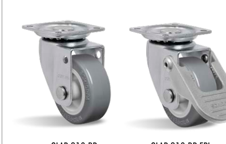
GLAP 210 BP