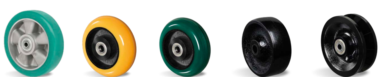
ALUMINIUM BCE ACE FN VR