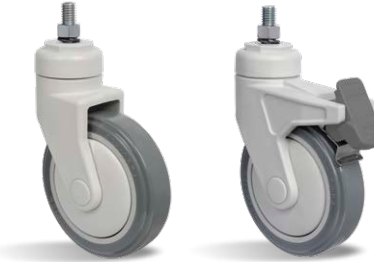
GNRE 412 BPE