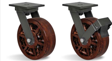
GPEX 124 CE GPEX 124 CE FP