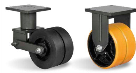
GDERX 124 BSE FDE 123 PE