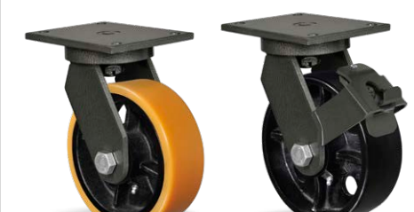
GMPX 83 PE GMPX 83 PE FPR