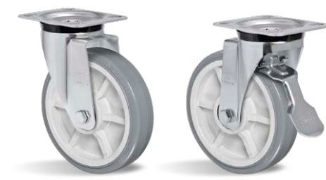
GSA 82 BPN GSA 82 BPN FP