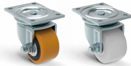
GMW 316 PE