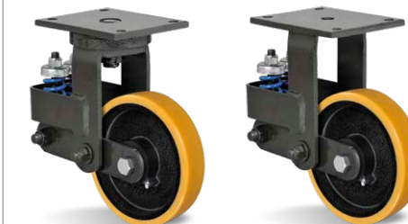
GCMX 82 PE FCMX 82 PE