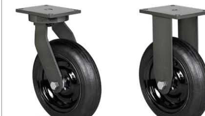
GPMX 2258 PMR FPMX 2258 PMR