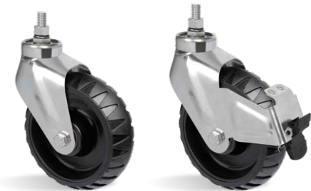
GSTRE 62 STRE