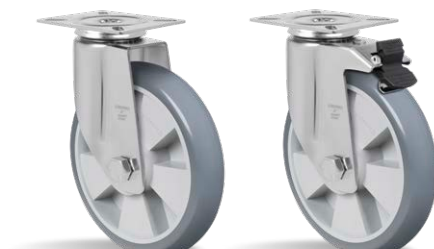
GL 816 BPN GL 816 BPN G