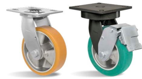
GS 82 ALPE GMX 62 ALPSSOFT FPD