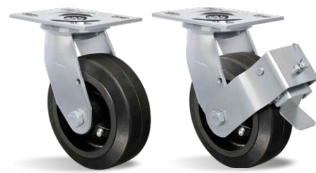
GS 62 BE GS 62 BE FP