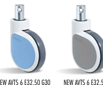
NEW AVTS 6 E32.50 G30 DF CAZ