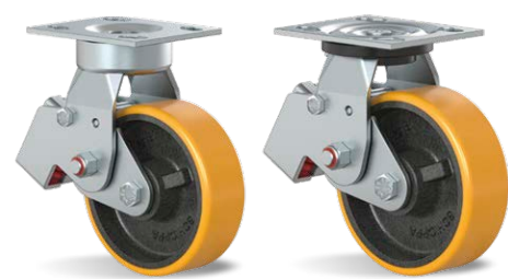
GCSX 62 PE GCS 62 PE