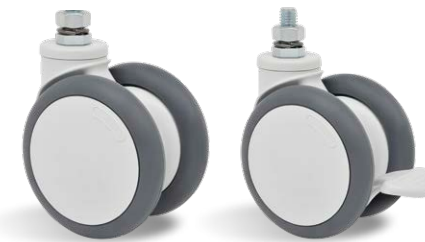
GD E12 100 TBE