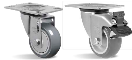
GL 312 BPE GL 312 BPE G