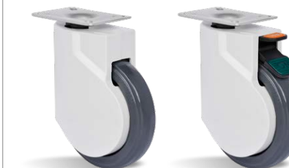
GHP 125 UPE