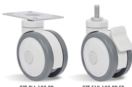
GZT PLA 100 BP